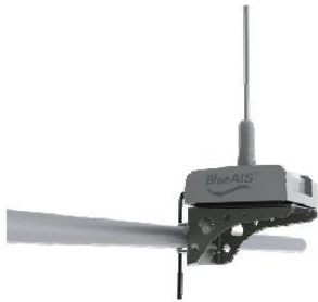
BlueAIS on UniMount Bracket

Een universele bevestigingsbeugel gemaakt van roestvrij staal. Voor installatie van de BlueAIS transponder op hekstoelen polen van verschillende diameters, horizontale rails, zelfs daken en andere horizontale oppervlakken