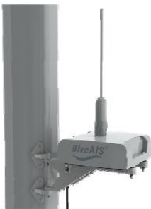
BlueAIS on MastMount Bracket

Wit gecoat aluminium mastbeugel ten behoeve van montage in de mast.